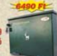
ajándék számszám lakattal