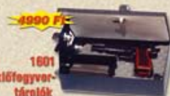
1601 Maroklófegyver- tartók