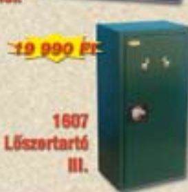
1607 Lőszertartó III.