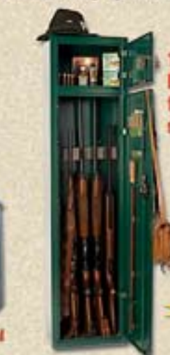
1608 Diana 5 fegyver- szekrény