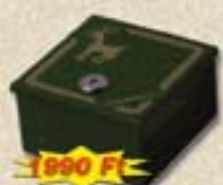
1603 Lőszertartó I.