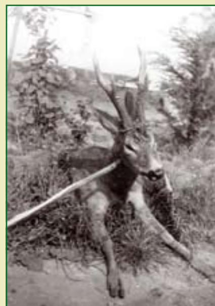
A szőregi nagy bak