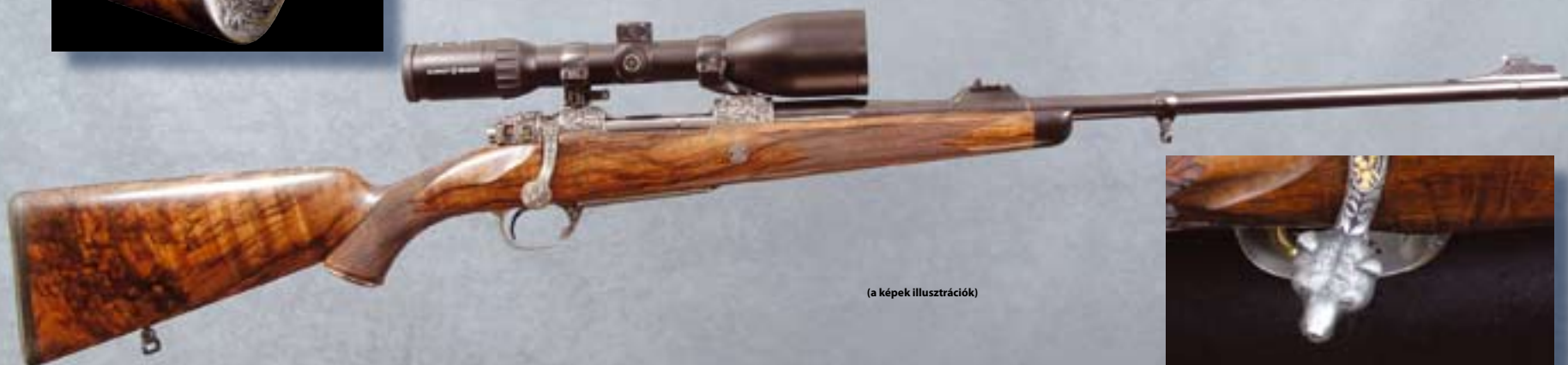
(a képek illusztrációk)