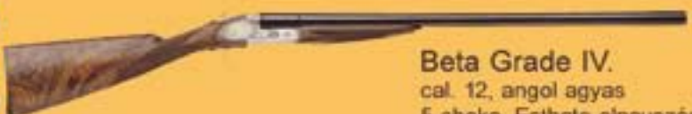
Beta Grade IV. cal. 12, angol agyas 5 choke, Esthete elnevezésű tokkal,