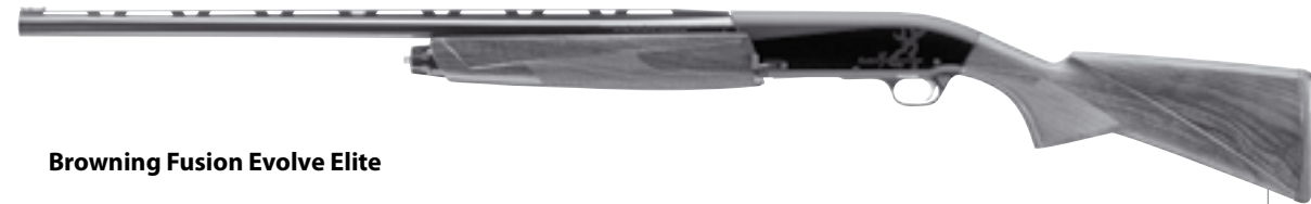
Browning Fusion Evolve Elite