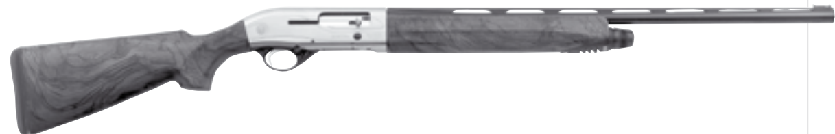
Beretta AL391 Teknys