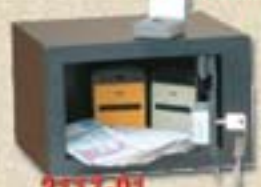
2117-01 Champion bútorszéf