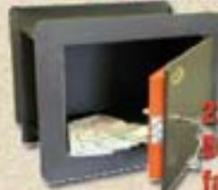
2213-01 Bárisz faliszéf