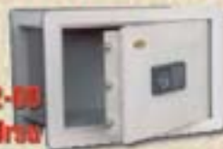
2252-08 Uro faliszéf

Rendelését ide küldje: 5600 Békéscsaba, Illésházi út 18. Tel/Fax: 66/444-391 E-mail: safety@trezor.hu