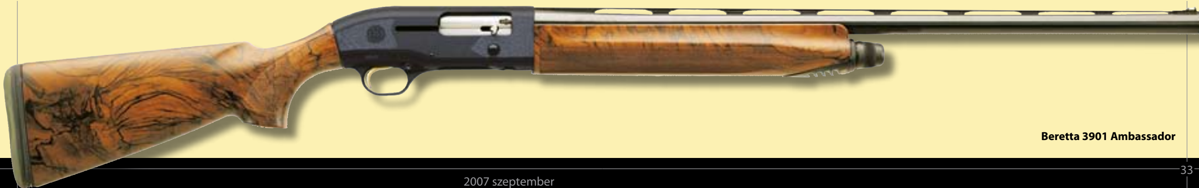
Beretta 3901 Ambassador