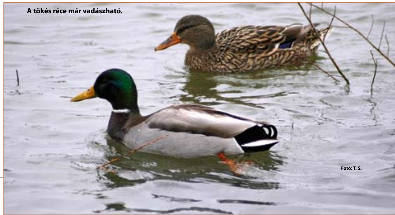
A tőkés réce már vadászható.

A vízivadszezon a tőkés és a csörgőréce vadászatával kezdődik. A kerce- és barátaréce, illetve a vetési lúd és nagylilik országosan október 1-jével vadászható – ám a nagylilik vadászatával a ti-