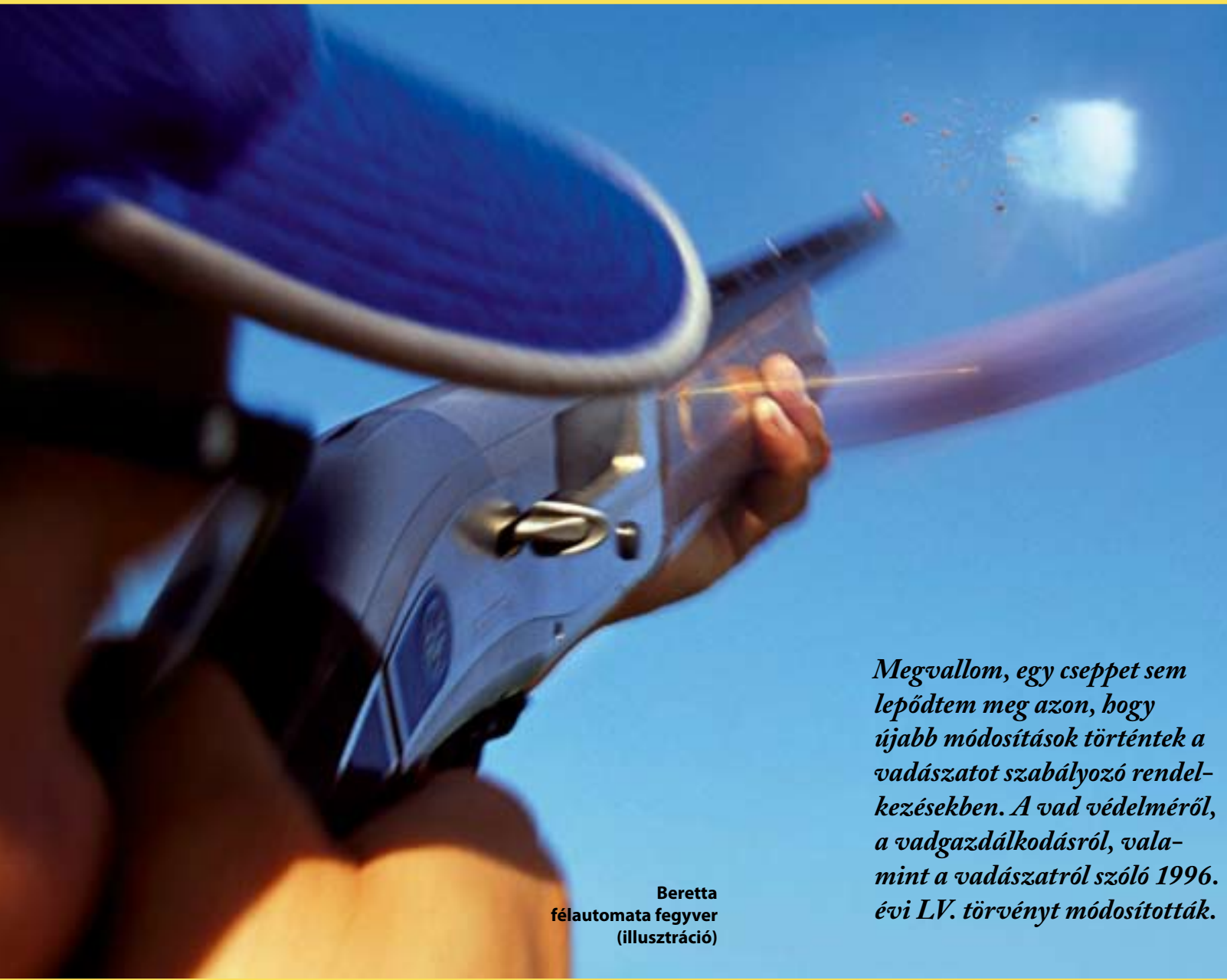
Beretta félautomata fegyver (illusztráció)

Megvallom, egy cseppet sem lepődtem meg azon, hogy újabb módosítások történtek a vadászatot szabályozó rendelkezésekben. A vad védelméről, a vadgazdálkodásról, valamint a vadászatról szóló 1996. évi LV. törvényt módosították.