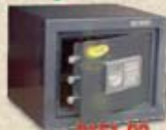
2151-02 Skorpió bútorszéf