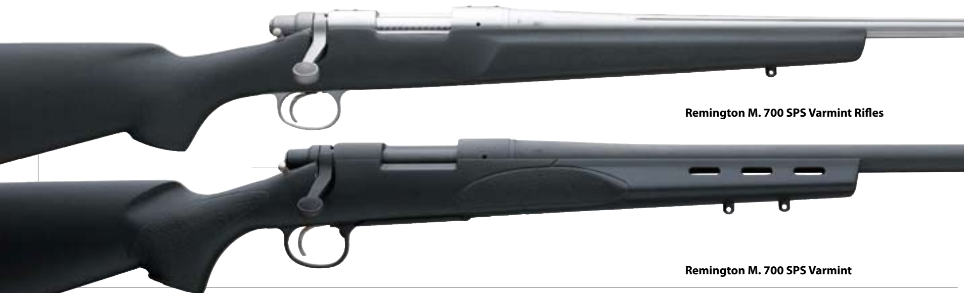
Remington M. 700 SPS Varmint Rifles

Ez a típus jött, látott és győzött! 2007-ben még mindig ez a típus jelenti a vállalat termékskálájának biztos alapját. Közel negyven változatban készült-készül, a könnyű, hegyi karabélytól az átlagos puska kivitelén át a hosszú csövű, nehéz versenyfegyverekig. Kínálják amerikai dióból formált tussal, rétegelt keményfából kialakítottal, de lehet fekete vagy terepszínű műanyagból is ez az alkatrésze. A cső és a zárszerkezet gyönyörű kékre vagy éppen ellenkezőleg, tompa árnyalatúra barnított szénacél. Ám ugyanez rozsdamentes acélból kivitelezve szintén kapható, s legújabban pedig ún. TriNyte nikkelbevonatot használnak, amely tökéletesen ellenáll mindenféle korróziónak. Agyazásuk általában egyenes formátumú, pisztolyfogásos, esőközépig nyúlik. De van olyan Mannlicher típusú változatuk is, amelynél a csőszájnál izléses acélkupakba zárva ér véget. Úgy vélem, ▶