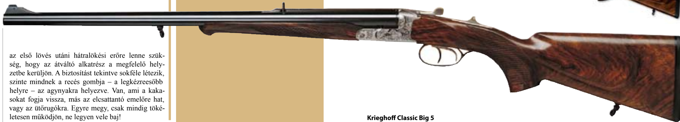
Krieghoff Classic Big 5