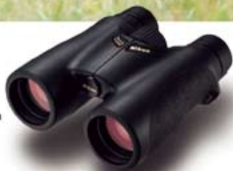
10x42 HG L DFC

Alapvető, komoly felszerelés: Ön is megtapasztalhatja, hogy miért, ha a kezében tartja az új HG távcsöveket. Tiszta, éles képével igazi élvezetté varázsolja a vadászatot, gyenge fényviszonyoknál és ködös, nedves időben is. A Nikon élesben is bizonyított technológiája mind az Ön szolgálatában áll: többrétegű lencsebevonat, víz és páramentes felépítés. Nikon HG L: hihetetlenül izgalmas élmény!