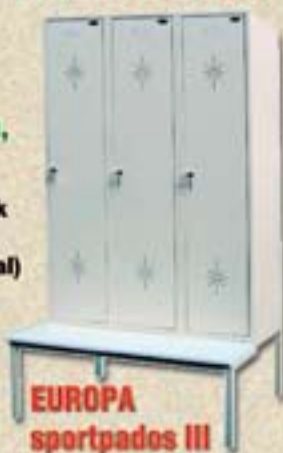
EUROPA sportpados III

Rendelését ide küldje: 5600 Békéscsaba, Illésházi út 18. Tel/Fax: 66/444-391 E-mail: safety@trezor.hu