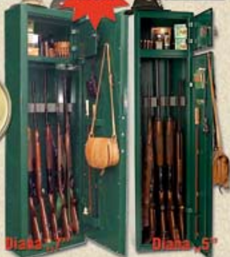
Diana „10” Diana „7” Diana „5”