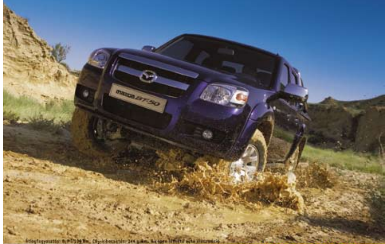
Fényképezte: Róbert János, Copyright©2013: 244 g/m, Az üzemeltető adatai változhatnak.

Mazda BT-50 modellek egyedi kedvezményekkel!