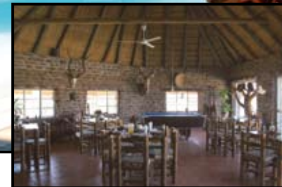
A szállás és a farm főépülete olyan volt, mint egy kisebb oázis.