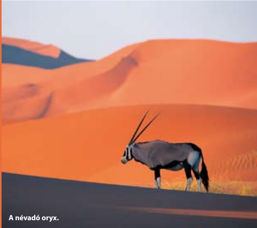
A névadó oryx.

Mielőtt rátérnék e lövedék fő jellemzőire, meg kell említenem egy érdekes tévedést, amely az elmúlt esztendő hazai szakajtójában újra és újra felbukkan. Több cikkben, sőt egy különben nagyszerű könyvben szintén az áll, hogy az Oryx a lapunk egy korábbi számában bemutatott Vulkan márkanevű termék egyszerű továbbfejlesztése. Nem tudom, honnan származik ez az információ, de egészen biztosan tévedésen alapszik, hiszen gyártó cégükön kívül semmi közük sincs egymáshoz. Más a kialakításuk és részben más a hatásmechanizmusuk. Ami azonos bennük, hogy eredeti svéd gyártmányok, s nagyszerűek a maguk nemében. A Norma cég tesztvadászaként nem esett nehezemre megszeretni ezt a két hírneves terméket, melyek közül most természetesen az Oryx lövedéket vesszük górcső alá. (Akit viszont a Vulkan (is) érdekel, lapozza fel a Magasles 2006. októberi számát.) A '80-as évek derekától fogva kínálják egybeszerelt töltényként, és külön magát a lövedéket úgyszintén.