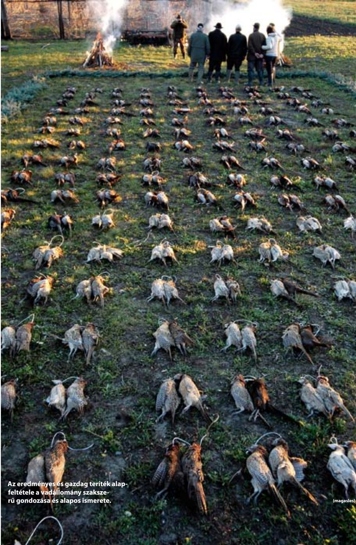
Az eredményes és gazdag teríték alapfeltétele a vadállomány szakszerű gondozása és alapos ismerete.

Amikor e sorokat írom, még az ősztendő utolsó napjait tapossuk, és mond- hatom, hogy az időjárás eddig igen kegyes volt hoz- zánk. A legtöbb terüle- ten az apró- és nagyvad egyaránt kielégítő kon- dícióban van. Senkinek ne legyen azonban két- sége afelől, hogy február havában lesz még igazi tél – amint az utóbbi évek tapasztalata is mutatta.