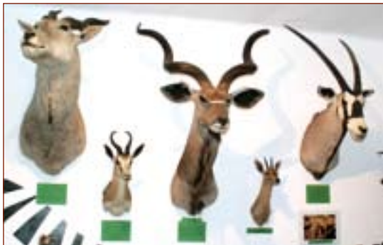
Afrikai hangulat az Őrségben (balra fent).

Ez az intézmény nem kap semmilyen állami támogatást, a házigazda feleségével tartja fenn, s mégis megelőző színvonalával némely államilag támogatott intézményeket.