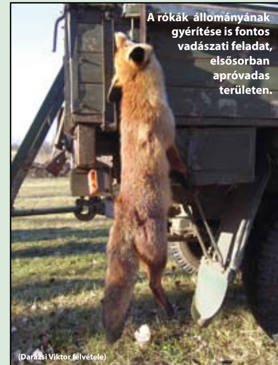
A rókák állományának gyérítése is fontos vadászati feladat, elsősorban apróvadász területen.

három rövid sírást adjunk, aztán várjunk húsz-harminc percet. A következő sírásnál már az is megtörténhet, hogy elijesztjük vele a rókát, aki azt hiszi, valami vetélytárs nyaggatja a még élő nyulat, de ha szerencsések vagyunk, akkor ennyi időn belül a róka beugrik. A jó nyúl-síp hangját akár nyolc-kilencszáz méterről is meghallja a róka és felénk indul. Ilyenkor még több a várakozás, a figyelem könnyebben elkalandozik, s bizony akad, hogy a zsákmány veszi észre előbb a vadászt. A rókahívás türelemjáték,