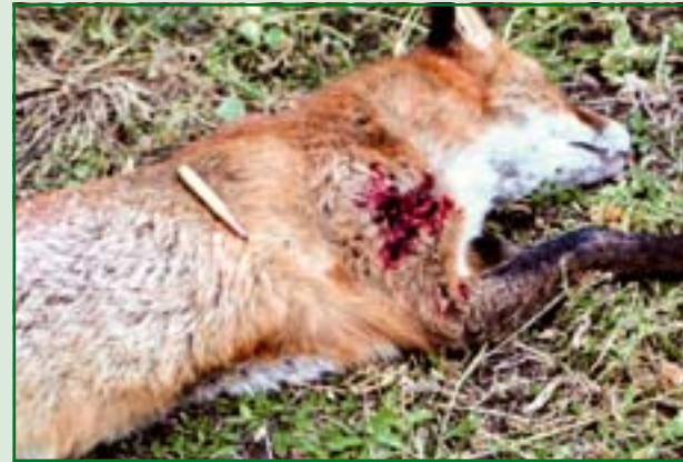
A viszonylag nagy kaliberű szabályozott expanziójú lövedék magja sem végez brutális roncsolást (30-06 Sirocco 11,7 g).

leges sebzéssel. Nyílt, belátható terepen jobb választás egy kis vagy közepkaliberű távcsöves golyós puska. Ha a gereznát fel akarjuk használni, érdemes valamilyen szabályozott expanziójú lövedékmagot alkalmazni, hogy a lövéssel ne tegyük tönkre a bőrt. Jól bevált az a módszer is, hogy a test közepére lövünk, mert itt a becsapódó lövedék, nem találkozik vastagabb csontokkal, ugyanakkor a találat hatásfoka elégséges a gyors kimúláshoz. A kis kaliberű, nagy sebességű töltények legalább olyan roncsolást végeznek a viszonylag vékony bőrön, mint a nagyobbak, így ezeknél a kalibereknél is használjunk keményebb lövedékmagot. A célnak kiválóan megfelelnek az 5-6 mm-es kalibercsoportok, a Norma, a Remington, a Winchester töltényei. Megfelelőek a 7-7,62 mm-es ürméretű fegyverek is, ha a hozzájuk választott lőszer az átlagnál laposabb röppályával, „tömör” magszerkezettel rendelkezik. A túl kemény köpenyű, nehezen expandáló RWS töltények itt jó szolgálatot tehetnek. Nagyon jó választásnak tartom a .243-as Winchestert, mert ötvözi a kis kaliberű és a közepkaliberű töltények előnyös tulajdonságait. A nagy sebességet, a lapos röppályát, a 3000 J körüli energiát és a minimális oldalszél-érzékenységet. A legjobbnak az amerikai gyártmányú Remington Accu-Tip töltényeket tartom. Nagy távolságon is igen pontos, szabályozott expanziójú maggal, igen jó ölőerővel rendelkeznek, hazai nagyvadaink elejtésére is alkalmasak.