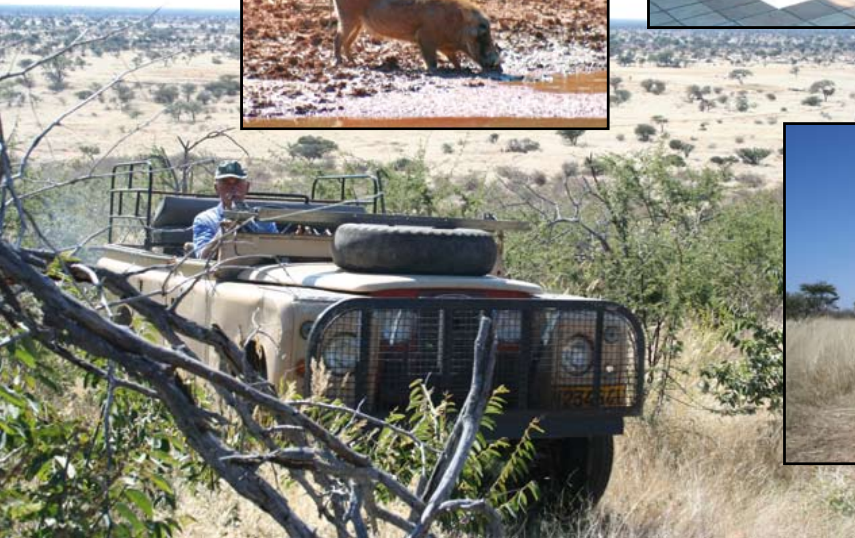
Számtalan antilop is puszkavégre került.