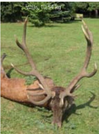
Villás, 10,54 kg

Területünkön szeptemberben összesen 31 db bika esett, az egész évi terv 40 db. A tavalyi rendkívül szegény szeptemberrel