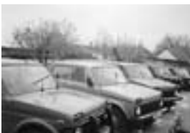
Lada Niva adásvétel, csere! Állandó 20-30 db-os készlet. Céges, törött és hibás is érdekel! Ugyanitt minősített kiegészítők. Bp. XXIII., Harasztú út 36/C Baja, Wesselényi u. 41. Tel.: 20/9518-492 (ef)