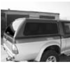
Pick-up keménytető ívesen hajlított sötét hátsó ajtóval, nagy terhelhetőséggel, méretpontos, masszív kivitelben nagyon kedvező áron eladót 30/277-6447 (ef)

Eladó Fiat Panda 4x4, friss műszaki, új gumik, vonóhorog sok alkatrészrel, jó állapotban, 217 E Ft. 30/978-0381