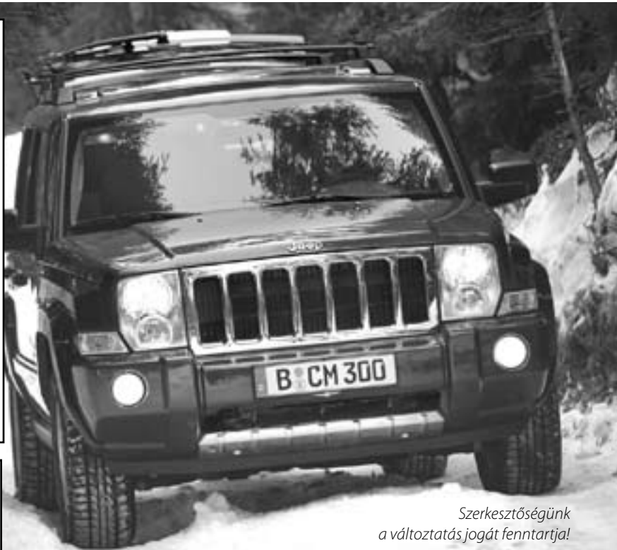
Szerkesztőségünk a változtatás jogát fenntartja!

Az idén tavasszal bemutatott Commander a Chryslerhez tartozó Jeep legnagyobb modellje, amely egyúttal az Észak-Amerikán kívüli modellofenzíva első tagja. A Jeep Grand Cherokee modelljével már korábban is megmutatta, hogy van létjogosultsága a terepjárók élvonalában. A Commander az ígéretek szerint még ezt is túlszárnyalja.