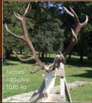
Nemesnáduvar, 10,85 kg.