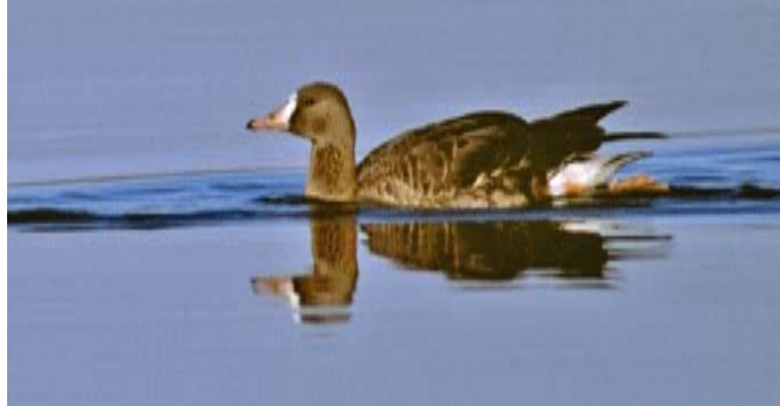
Nagy lilik