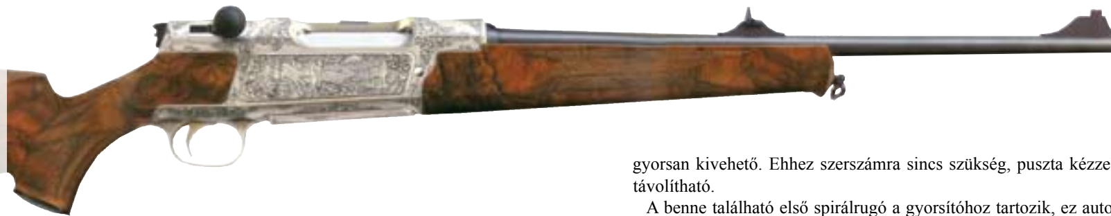
Strasser Modell RS 05