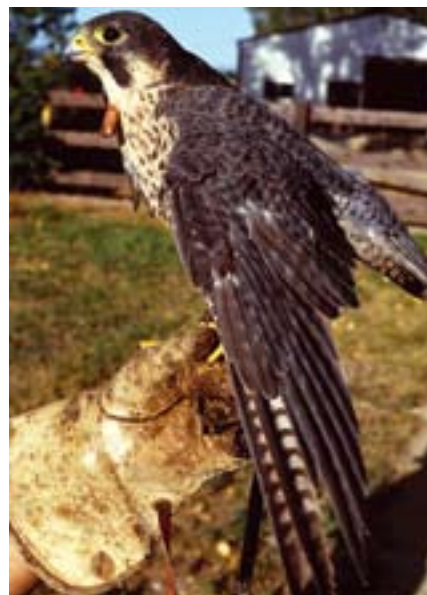
Amerikai prérisólyom (magasles)

tól augusztusig nem repülnek, a tenyésztésbe fogott példányok pedig ritka kivételtől eltekintve ezt követően sem. A természet tehát „elvárja” ilyen esetekben a kíméletes bánásmódot a solymászkóttól!