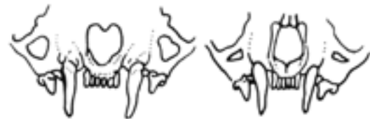
A hermelin és a menyét koponyájának összehasonlítása.

Különösebb vackot nem épít, kisebb kotorékokban, faodvakban húzhatja meg magát. Elsősorban kisemlősökkel, üreginyúlakkal, madarakkal és tojásokkal táplálkozik. A baromfiban végezhet pusztítást, esetleg a tojásokat is feltöri. Áldozatának leggyakrabban