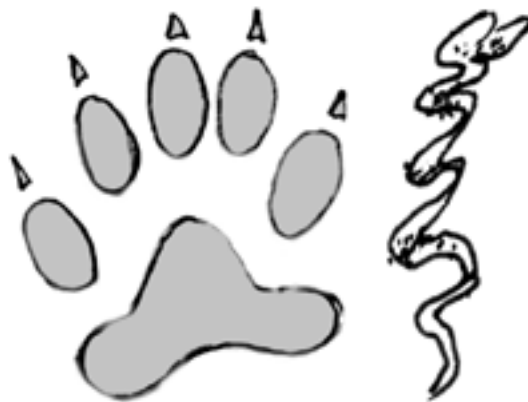
A hermelin lábnyomának sematikus rajza.