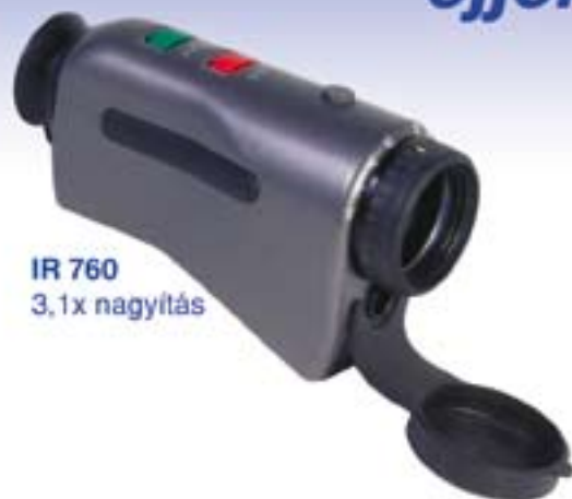
IR 760 3,1x nagyítás