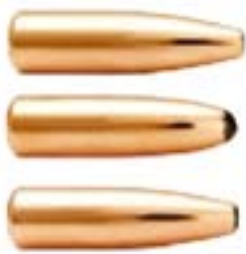
A Norma cég lövedékkínálata 8x57 JS kaliberhez

Kedves történetének múltja 99 esztendőre rúg. 1905-ben a német hadsereg – számomra ismeretlen okból – az 1888-tól szolgáló 8x57I (vadászváltozata: 8x57J) muníciót átalakította, egyben rendszeresítette is 8x57IS elnevezés alatt. A hüvely méretei megmaradtak, csupán a lövedék átmérőjét és alakját módosították. Az átmérő változtatása egyben új kalibert is eredményezett. A régi pontos mérete: 8,1 mm volt,