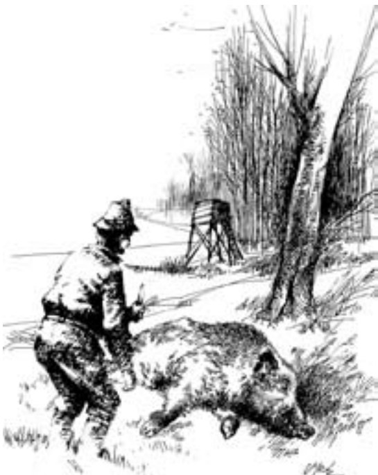
(Mráz János rajza)

Ha zsákmányunkat bizonyos ideig kint kell hag-