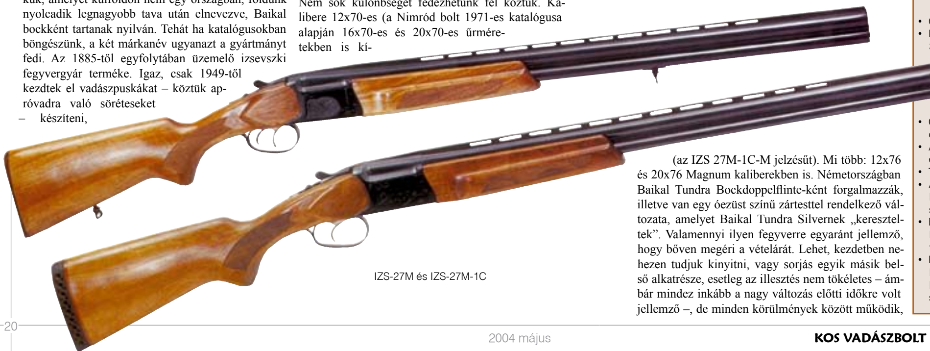
IZS-27M és IZS-27M-1C

(az IZS 27M-1C-M jelzésűt). Mi több: 12x70 és 20x76 Magnum kaliberekben is. Németországban Baikal Tundra Bockdoppelflinte-ként forgalmazzák, illetve van egy ózüst színű zárttesttel rendelkező változata, amelyet Baikal Tundra Silvernek „kereszteltek”. Valamennyi ilyen fegyverre egyaránt jellemző, hogy bőven megéri a vételárát. Lehet, kezdetben nehezen tudjuk kinyitni, vagy sorjás egyik másik belső alkatrészre, esetleg az illesztés nem tökéletes – ám bár mindez inkább a nagy változás előtti időkre volt jellemző –, de minden körülmények között működik,