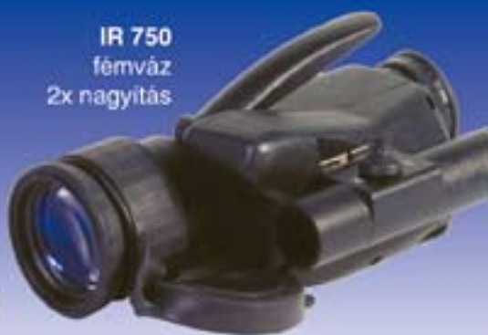
IR 750 fémváz 2x nagyítás