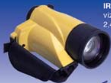
IR 780 WP vizálló 2,4x nagyítás