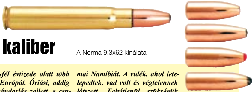
A Norma 9,3x62 kínálata

A múlt századelő alig másfél évtizede alatt több mint tízmillióan hagyták el Európát. Óriási, addig soha nem látott munkaerő-vándorlás zajlott, s csupán Németországból félmillióan utaztak a tengerentúltra, boldogulásukat, jobb életet keresve, vagy egyszerűen a kalandvágy sarkallta őket. Nagyjából Amerikában kötöttek ki, az „ígéret földjén”, de rengetegen választották végcélként az akkori afrikai német gyarmatokat, Kelet-Afrika jókora területét és a