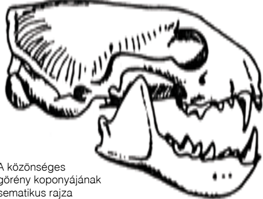
A közönséges görény koponyájának sematikus rajza

Fő táplálékuk a kisemlősök, üregi nyulak, békák, gyíkok, madártojások, madárfiókák. A közönséges görény a baromfiban is végezhet pusztítást,