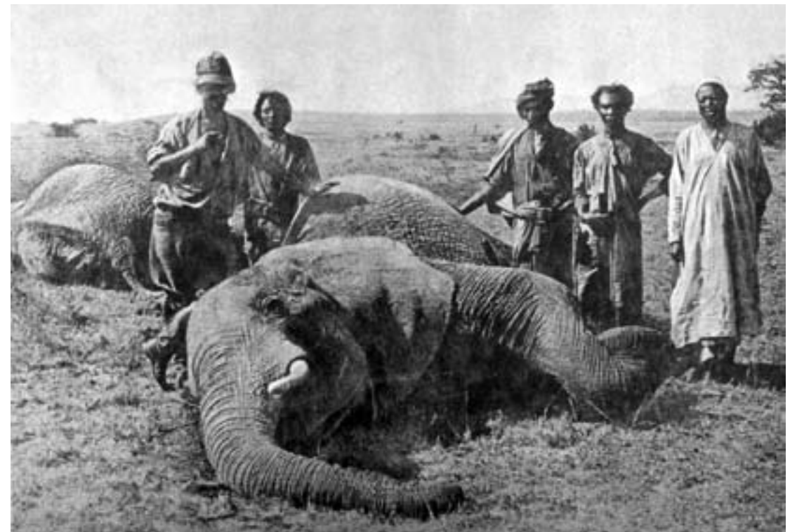
Két elefánt egy napon (archív)

száz antilopot...”. Nem kevésbé tanulságos az előző év egyetlen hetének eseménysorozata sem. 1887. április 21.: „ Esőben megyünk vagy még másfél órányit, dombos, helyenként mocsaras vidéken, sok nyomot látunk, de vadat egyet sem. Újból vadászni indulunk. Höhnelt három lövéssel három rinoceroszt lő, de csak kettőt talál meg. Én két nagy rinoceroszt lőttem. Éjjel nagy eső. A tábor a Kilimandzsáró nyugati végében, patakparton van. ” Április 22.: „ Mára ittmaradunk, mert embe-remnek meg kell szárítani a húst. Höhnelttel vadászni megyek. Höhnelt megtámadja egy rinoceroszt, s közben egyik embere menekülés közben össze-vissza karcolja magát a bozótban. Én semmit sem látok. Höhnelt egy rinoceroszt lőtt. ” Április 23.: „ Indulás zuhogó esőben. Dél tájban tábor is verünk. Délután vadászni megyek, négy rinoceroszt látok. Meg kell őket kerülnem, de találkozom egy újabbal, amelyik rossz irányból fújó szélben épp felém tart. 150 lépésről észrevesz és menekül. Erős sebet ejtek rajta az 577-sel. Nagyon vérzik, de nem találom meg. A nyílt terepen látok még 22 zsiráfot is. Semmit sem tehetek. Hazafeléúton lövök egy rinoceroszt, ugyanakkor tölem 30 lépésnyire fúj-tatva vágott át három rinoceroszt a bozótoson, egyikükre rálőttem, de a szürkület beállta miatt ott kellett hogy hagyjam. Karo összetörte az evezőimet, Ali elégette a cipőmet, Gama elvesztett két sátorkötelet. ” Április 24.: „ Indulás a Lederik folyó mentén. Maszaj