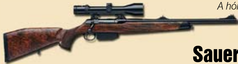
A hónap puskája