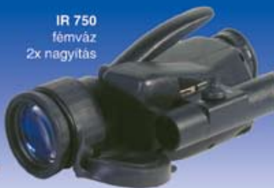
IR 750 fémváz 2x nagyítás