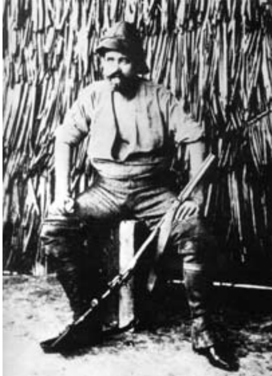
Széki Teleki Samu a nagy út elején

Ebben az időben már volt példa egzotikus vadászatokra, bár ezek természetesen mindvégig különlegeseknek számítottak. Andrássy Manó gróf 1851-ben Ceylonban és Jáván, majd Forgách Károly gróf, Ká-