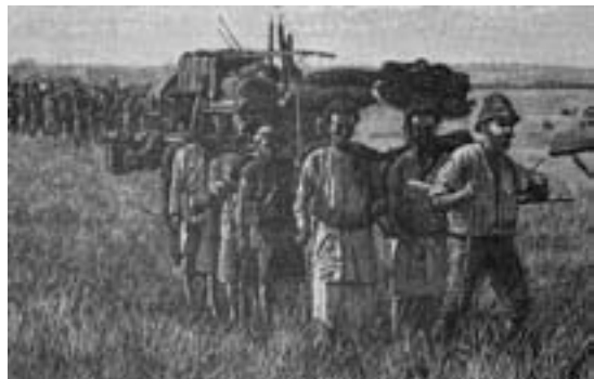
A kilométer hosszú karaván a maszai szavannán, valamint közelharc

A harmadik óriást, a vízilovat, alig háborgatják, az egész úton csak néhányat ejtenek el. A víziló nappal általában a vízben tartózkodik, és meglöve elmerül, elvész. Teleki sosem szórakozásból gyilkolja a vadakat, mint az időben sok angol „sportsman”, akik a szerencsétlen állatok haláltusájában gyönyörködnek – a víziló, mielőtt elmerül, hatalmas örvényt kavarva pörög a vízben –, majd otthagyják a tetemet. Ha Teleki Sámuel gróf meghúzza a ravaszt, annak más oka van: trófea, az expedíció élelmezése és tudományos gyűjtés. Vagy éppen önvédelem, legyen szó emberről vagy állatról. „A folytonos vigyázás ámitástól mindnyájunk nervusai odavoltak. Én egy hónapig nem vetköttem le – írja Teleki –, és folyton lábon éjjel-nappal őriztem embereim, hogy készen legyenek verekedni; másrészt a békét ne zavarják... A határon azonban, midőn a falukat elhagytuk, keresztül kellett lőni magunkat. Utolsó ütközetben 60 halott és két utolsó menetben 16 darab hullott ... itt már nem kellett diplomataizálni, kikuju és rinocérosz egyforma volt...”