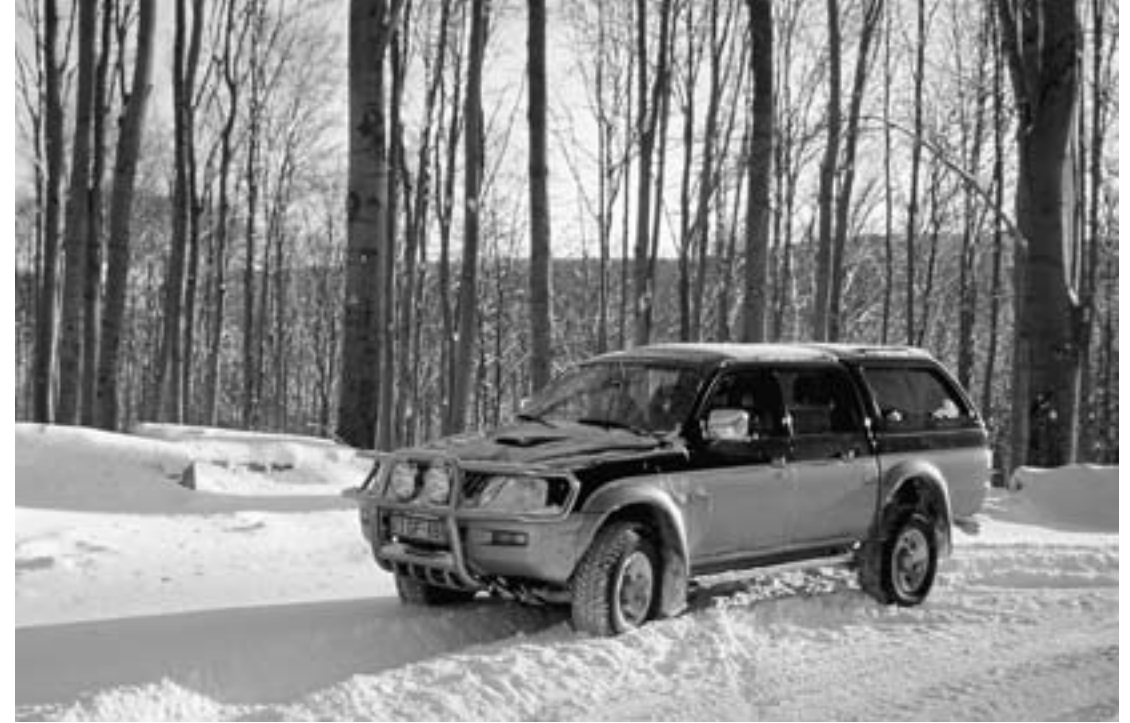
Mitsubishi L 200