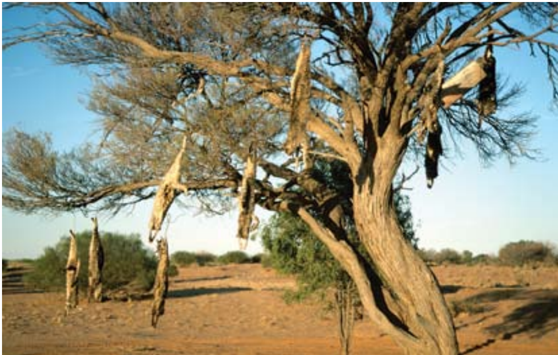
Kísérteties látvány: lőtt macskák tetemeit lengeti a szél egy sivatagszéli fán.

Talán szebb trófeát ad az ugyancsak Ázsiából (Jáva, Timor, Molucca-szigetek) származó rusa szarvas ( Cervus timorensis ), melynek legjobb állományait a Sydneytől délre fekvő Királyi Nemzeti Parkban találhatjuk. Mivel környezetidegenek és dagonyázásukkal meglehetősen sok kárt okoznak az őshonos növényzet-