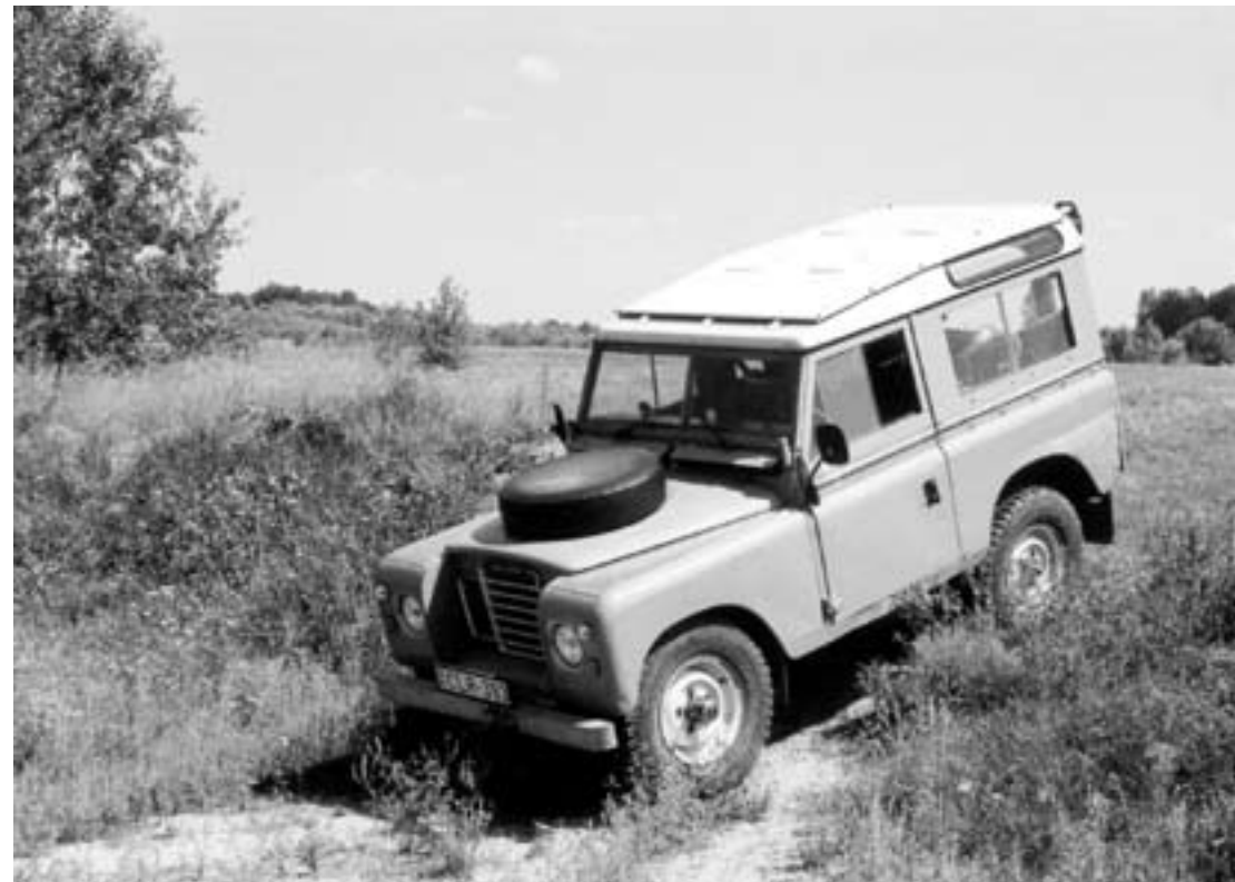
Land Rover Defender

Az értékesítési eredmények természetesen nem az autók minőségének hű tükrözői, hiszen a típusválasztásnak százféle szempontját is figyelembe vehetjük. Az évente eladott 2-3 Hummer H1 és a 100-110 Renault RX4 közötti különbséget sem az eladott példányok számával mérjük. Más műfaj, más közönség, más szolgáltatás – a maga nemében használójának mindkét típus nagy örömet, igazi élményeket szerezhet. Mindenesetre tény, hogy a konkrét típus kiválasztása a vadászok – főleg a hivatásosok – nagy részénél bizony keményen pénztárca függvénye, húsba vágó döntést kíván.