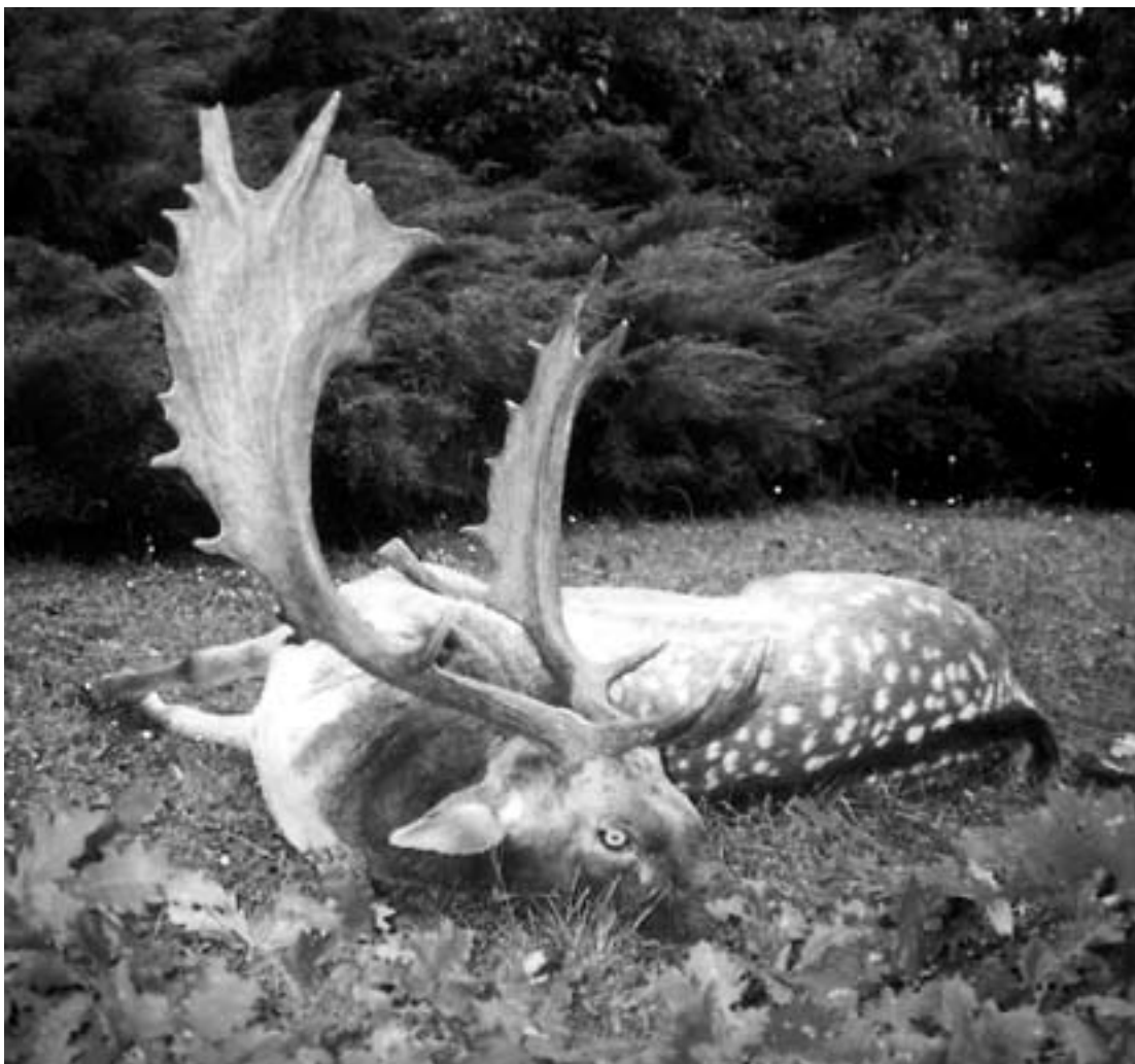
Aranyérmes dámbika, 3,85 kg súlyú tróféával (Budakeszi erdészet).