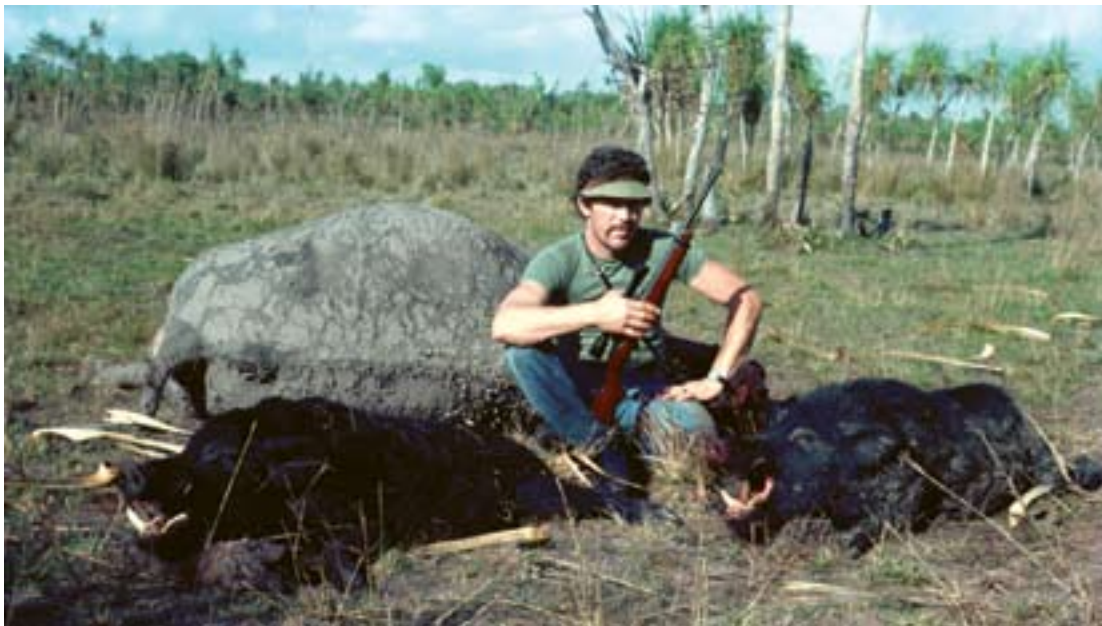
A háttérben alig felismerhető bivalydögre jött ez a két nagy kan.

Kezdjük talán a legszerényebb, de ugyanakkor legnépszerűbb vaddal: az üregi nyúllal, azaz a kiniglivel ( Oryctolagus cuniculus ). Ezt a látszólag ártatlan apróvadat 1858-ban telepítették be Ausztráliába. A betelepítés kimondottan a vadászatot szolgálta, de a bőséges eledel és a természetes ellenség hiánya révén a nyulak hat évtized alatt olyannyira elszaporodtak, hogy az akkori mezőgazdaság egyik legnagyobb problémáját jelentették. Hatalmas birtokok váltak használhatatlanná a nyúlmilliók révén, a kopár, rágott pusztaságokban még a kisebb cserjék, alacsonyabb fák sem maradtak meg, mert a környezetéhez könnyen alkalmazkodó kinigli még a fára mászást is megtanulta. Vadászattal, csapdázással, mérgezéssel sem lehetett a hihetetlen tömegű állományt csökkenteni, egészen addig, míg 1950-ben el nem kezdődött a myxomatosis