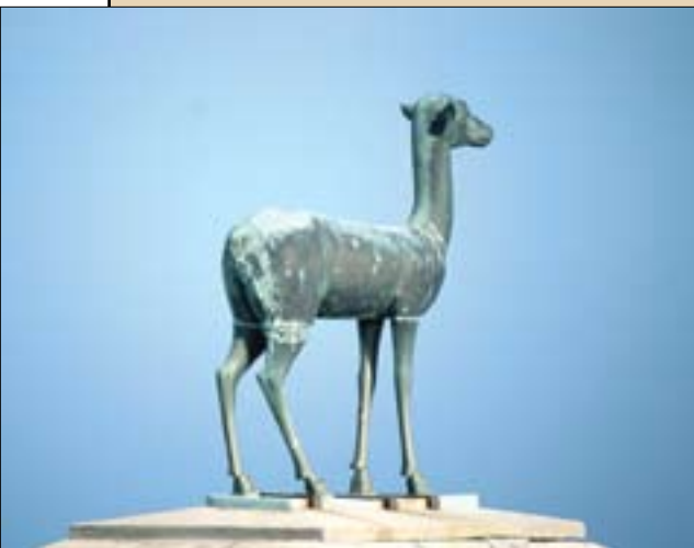
A rodoszi kikötő dámvad szobra. Helyén egykor a Kolosszus szobor egyik lába állt.

Sok száz éves elszenesedett dámlapát a Szími Múzeumban.