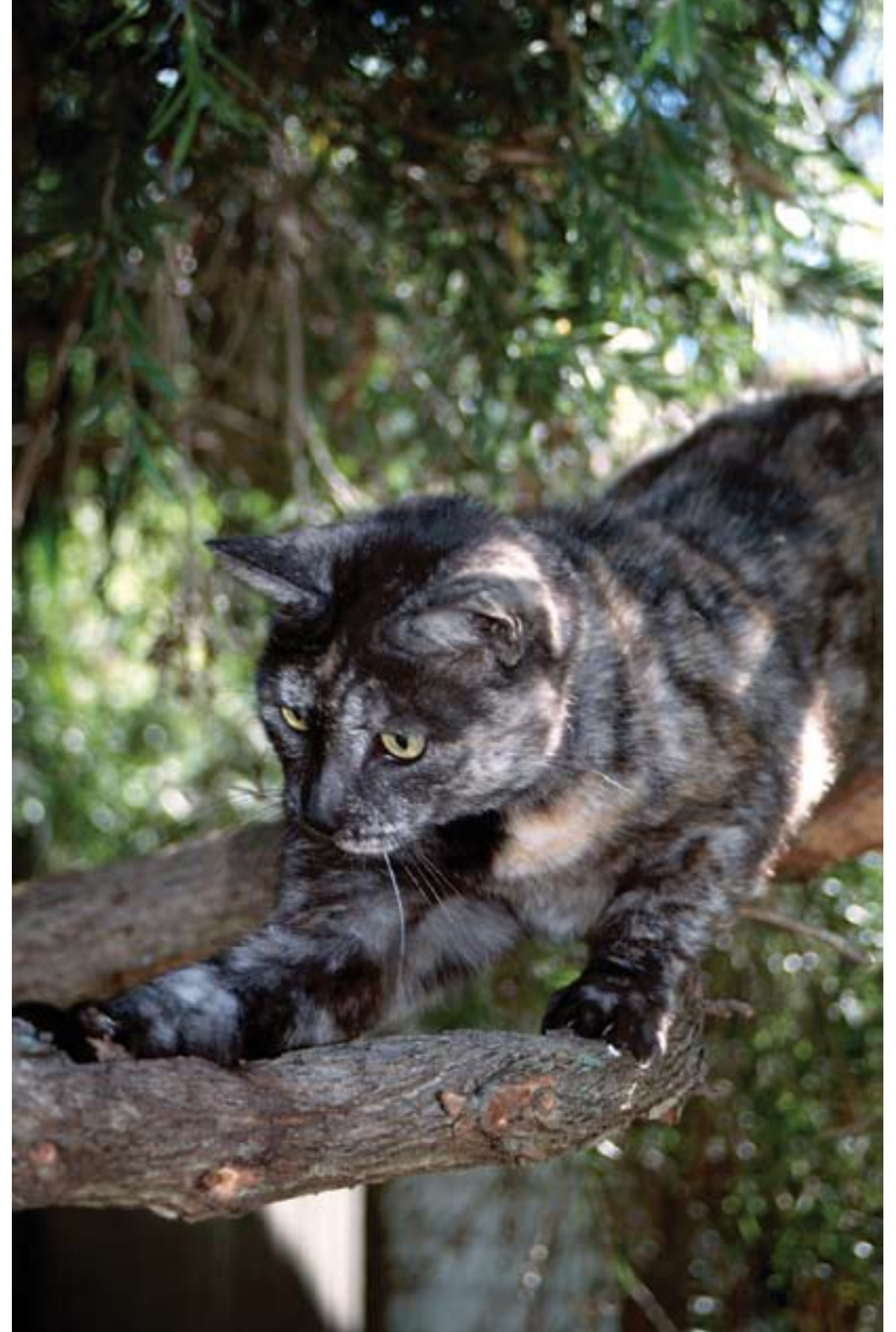
Az elvadult házimacska Ausztrália egyik legkártékonyabb dűvada.