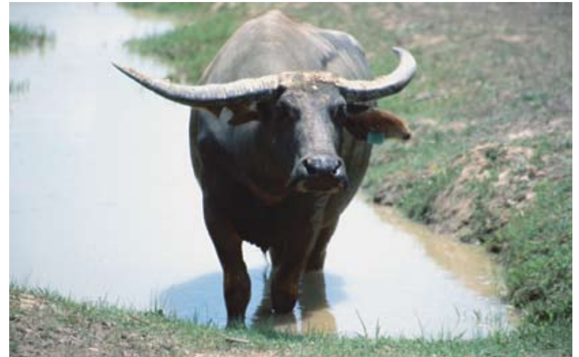
A vízi bivaly egykoron gyakori vad volt az Északi terület ingoványos, lápos síkságain.