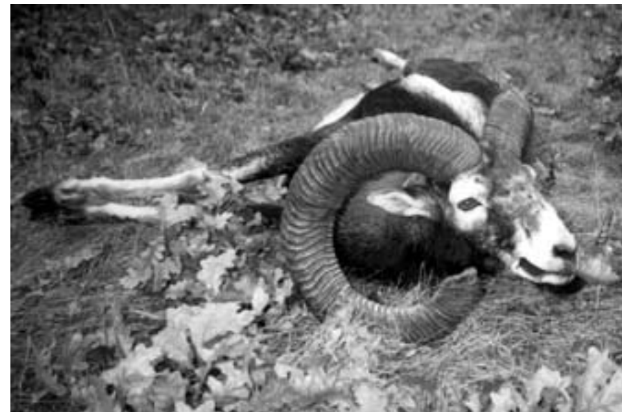
Muflonkos 91/87 cm hosszúságú csigával (Budakeszi erdészet).