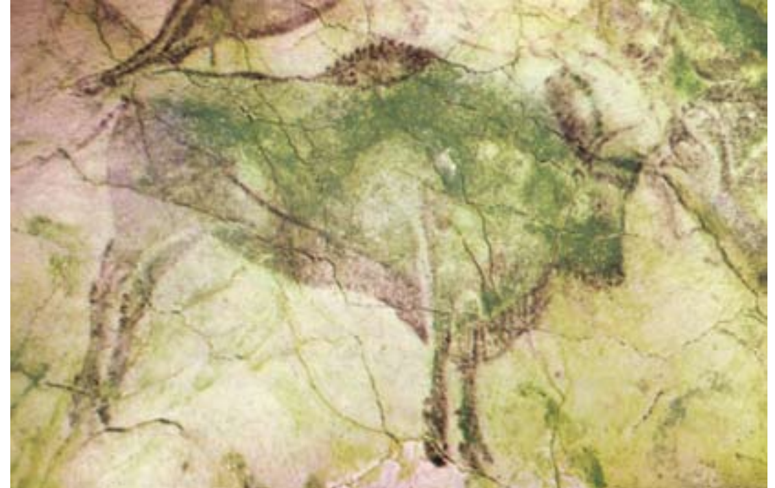
A spanyolországi altamirai barlang falfestménye, kb. 15 ezer évvel ezelőttről.

A vadász a „vad” szóból származik. A vadak többnyire az erdőben élnek. Több nyelvben is megfigyelhető a nyelvi-gondolati párhuzam az „erdő” és a „vad” szavak között. A francia sauvage 'vad' szó